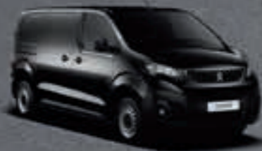
Черный Noir Perla Nera*