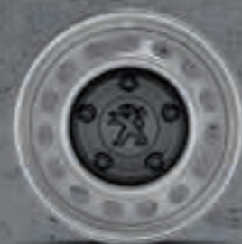
Колпаки 16'' малоразмерные (стандарт)