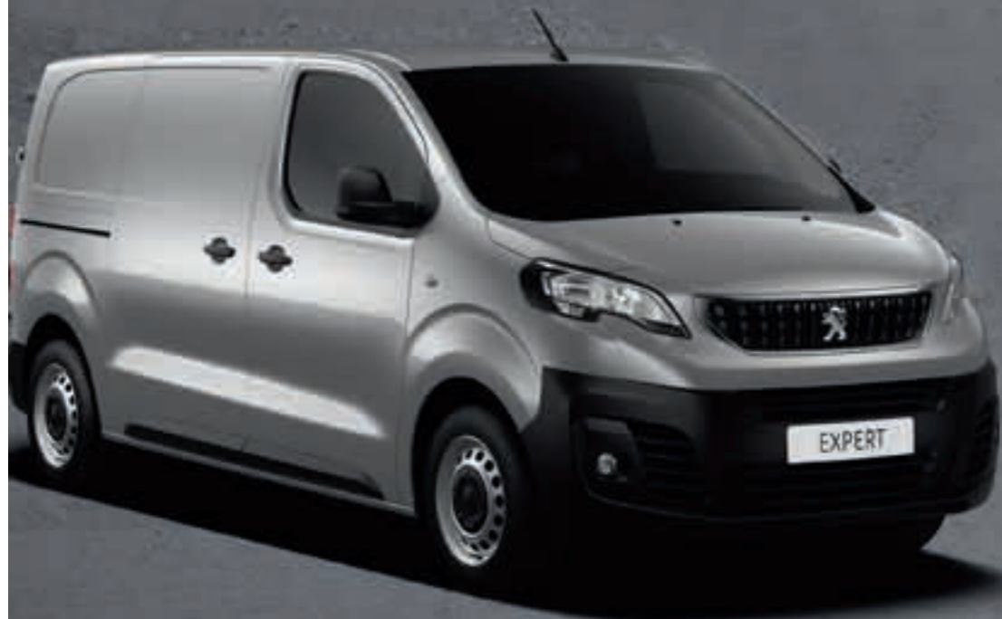
Серый Gris Aluminium*