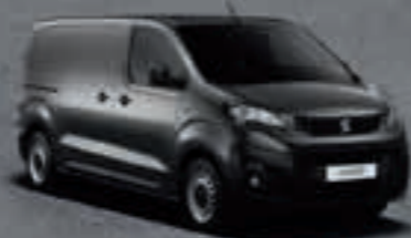
Серый Gris Platinum*