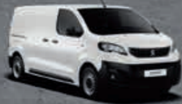
Белый Blanc Banquise