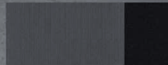
Тканевая обивка Curitiba Monoton